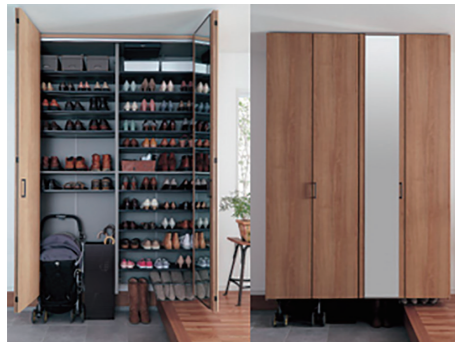
靴も大きなモノも賢くしまえる、新・玄関収納 「クロークボックス」